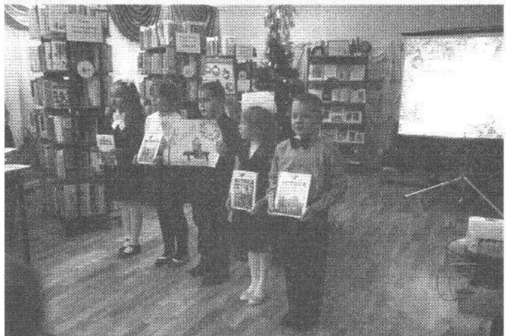
Юные участники конкурса из школы № 42

Одним декабрьским вечером я, обняв свою любимую бабушку, попросила ее рассказать о том, как в ее детстве они проводили новогодние каникулы. Трудное было время, но деревенские ребята радовались даже самому малому. Ёлка на Рождество была большой редкостью. Обычно дети украшали огромный куст шиповника, который рос в палисаднике перед домом. Этот куст как будто берег свои красные плоды, как украшения, к светлому празднику Рождества Христова, но дети все равно мечтали о настоящей рождественской ёлочке. И однажды мой прадедушка вместе с моей бабушкой, тогда одиннадцатилетней девочкой, взяли санки и отправились за елкой, по льду замерзшей Волги, на противоположный берег, где был редкий лес. В тот год в семье случилось рождественское чудо – у них было очень пахучее, светлое и радостное Рождество, да еще и с настоящей Ёлкой! В сочельник праздничный стол по-