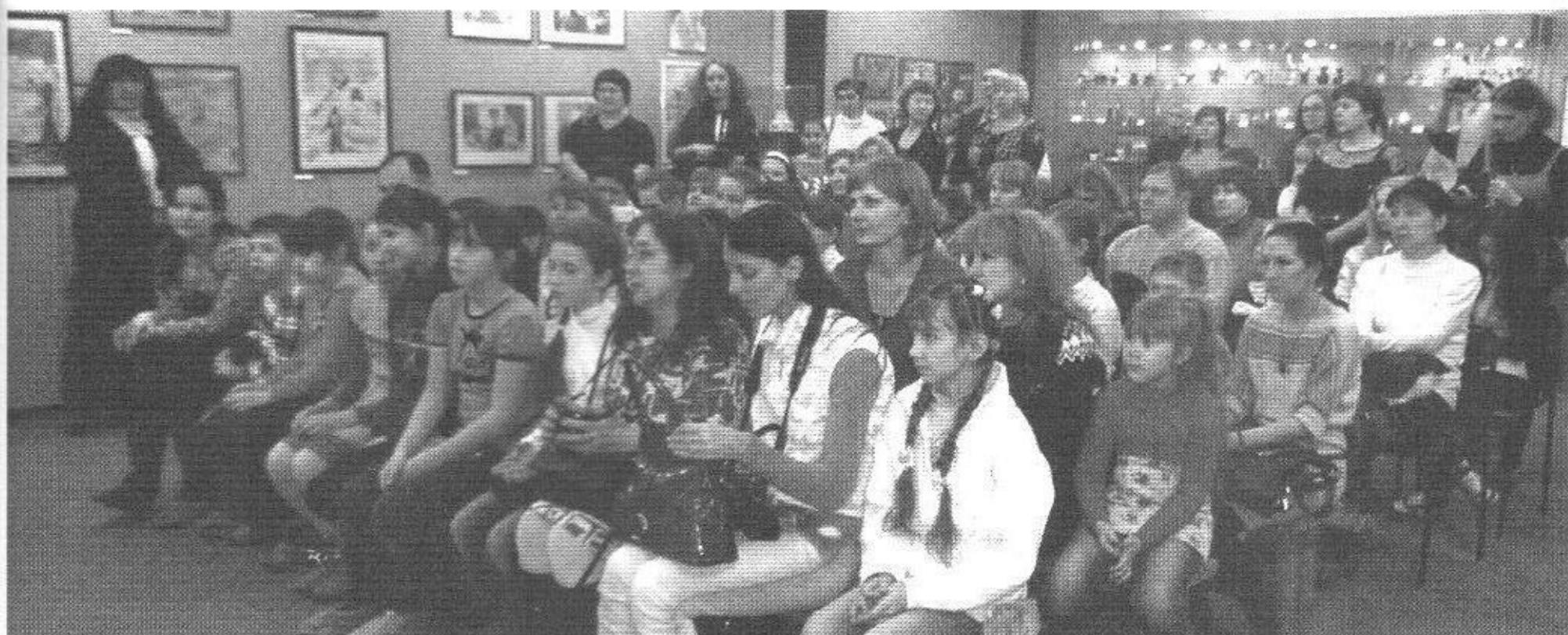
Музей народного творчества. Открытие выставки «Рождество в твоём доме»