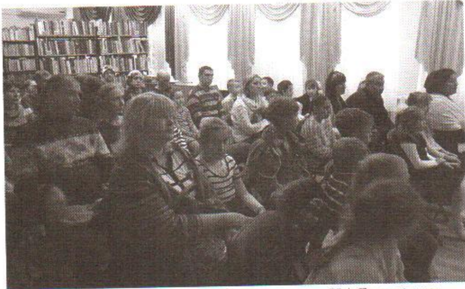
Центральная городская библиотека им. И.А. Гончарова. Подведение итогов конкурса в номинации «Литературное творчество»

кие лоскутки материи складывались в мягкое цветное одеяло памяти о традициях семьи, оно укрыло меня. Нежные, теплые руки бабушки и сон обняли меня, я задышала ровно, я спала.... Мне снилось Рождество.