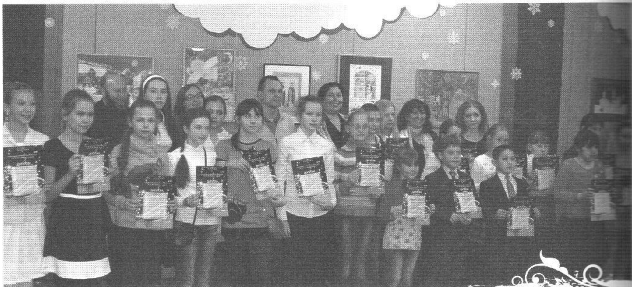
Члены жюри и участники конкурса «Истоки моих семейных традиций»